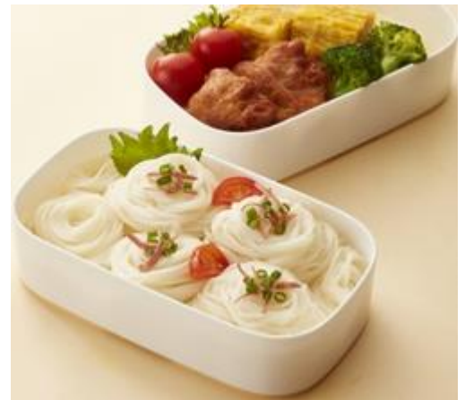
(図2 そうめん弁当イメージ写真)

本品はそんなそうめん弁当を持って行きやすいように、 小袋タイプのめんつゆ を発売。持って行くときもかさばることがなく、また ぶっかけタイプ なので、固まった麺も簡単にほどけて、つるっと食べられます。