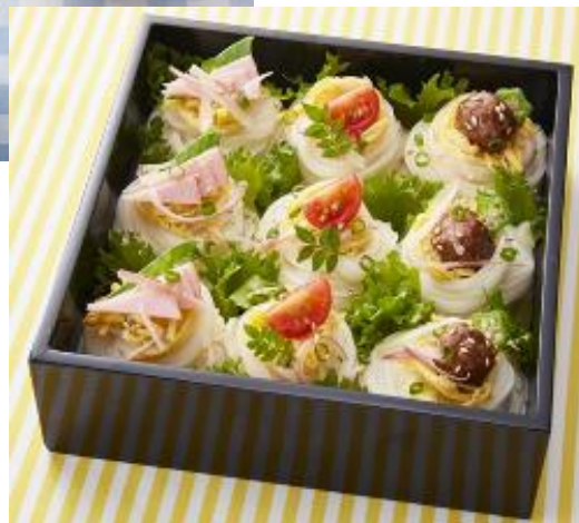
(図3 ハレの日そうめん弁当のイメージ写真)

そうめん弁当は、日々のお弁当のメニューバリエーションの1つとしてはもちろんのこと、運動会や行楽などの ハレの日 にも活躍します。トマトやネギ、みょうが、オクラ等々、色取りどりのトッピングを施せば、見た目も華やかなインスタ映え弁当の完成です。お弁当の食シーンを広げると共に、そうめんの魅力アップも狙います。