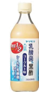
ヨーグルト味 糖質&カロリーハーフ