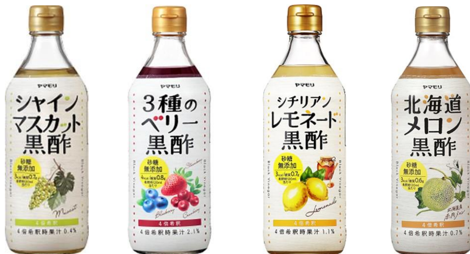
シャイン マスカット

当社は本シリーズ・本商品を通して、ビネガードリンクユーザーへより安心して継続飲用できる価値を提供するとともに、これからも消費者の心身の健康増進に役立つ、おいしく機能的な商品の開発に努めてまいります。