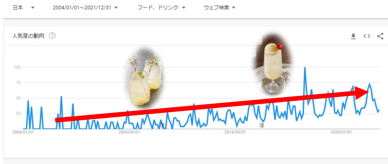
図表③ 「メロンソーダ」検索数推移

高級感のある北海道産赤肉メロンの果汁を使用し、水で希釈すると果肉感のあるフレッシュジュースのような味わいで、炭酸水で希釈すると、本格的で大人な「メロンソーダ」風の味わいで、黒酢を楽しむことができます。