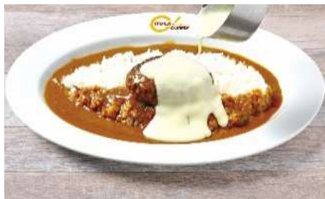
グランプリカレー