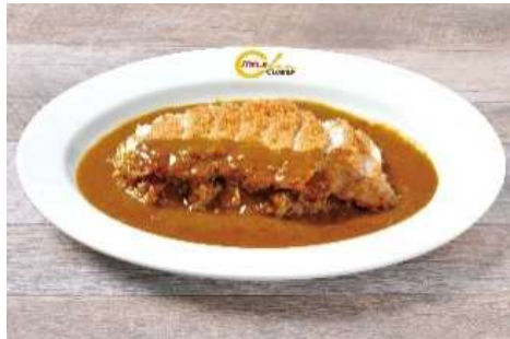
1 番人気 カツカレー