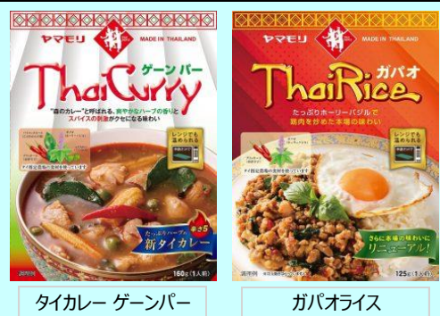
タイカレー ゲーンパー