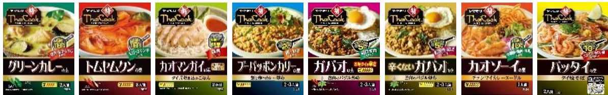
グリーンカレーの素 トムヤムクンの素 カオマンガイの素 ブーパッポンカレーの素 ガバオの素 本場タイの辛さ 辛いガバオの素 カオソーイの素 パットタイの素