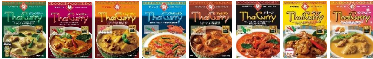
タイカレー グリーン タイカレー レッド タイカレー イエロー タイカレー ブーパッポン タイカレー マッサマン タイカレー パネーン タイカレー ブラック タイカレー マンゴー