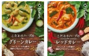
こだわりのハーブのグリーンカレー こだわりのハーブのレッドカレー