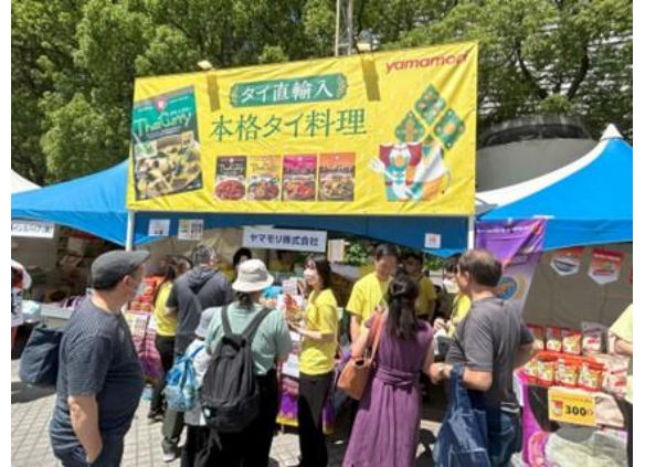
黄色の看板が目印：ヤマモリタイブース