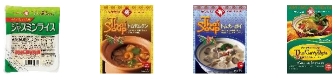
ジャスミンライス トムヤムクン トムカーガイ グリーンカレーペースト