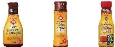
ナンブラー 150ml ナンブラー 100ml スイートチリソース